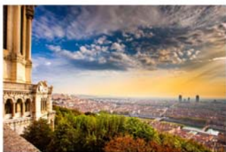
Vue depuis Fourvière