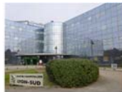
Hôpital Lyon Sud