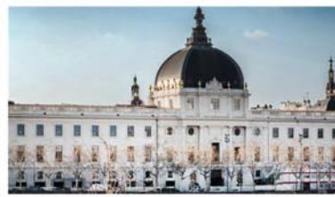
Le nouvel « Grand Hôtel Dieu »