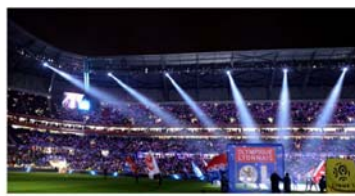
Le Groupama Stadium / Olympique Lyonnais