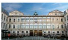
Hôpital de la Croix-Rousse