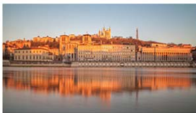
Vue de Fourvière depuis les quais du Rhône