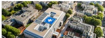
Hôpital Edouard Herriot