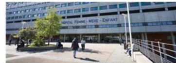
Hôpital Femme Mère Enfant