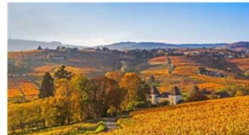
Les vignobles du Beaujolais